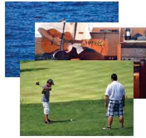
趣味やスポーツのワンシー ンをいつも身近に