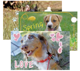
スマートフォン等でデコレー ションした写真でも OK!