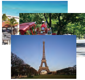
旅行の思い出が詰まった 写真集として